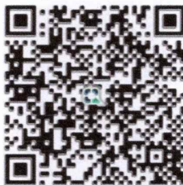
QR Code ชำระเงินค่าสมัคร

๕.๗ หลักฐานการชำระเงินค่าสมัคร ๕๐๐ บาท โดยโอนเงินผ่านบัญชีออมทรัพย์ธนาคารกรุงไทย ชื่อบัญชี สถาบันเทคโนโลยีปทุมวัน เลขที่บัญชี ๐๐๘-๐-๐๐๗๕๕-๔ หรือชำระผ่าน QR Code